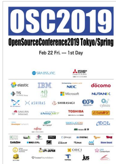
当日配布のプログラムの表紙